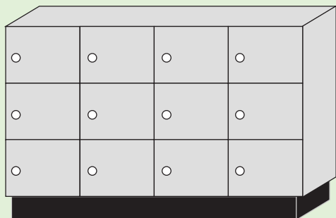
【C】複数ボックスタイプ(大型)